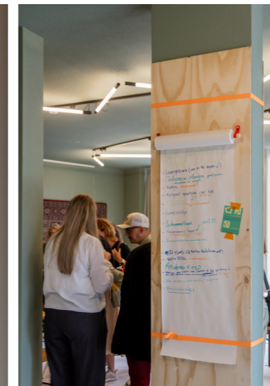
DE GEMEENSCHAPPELIJKE WOONKAMER