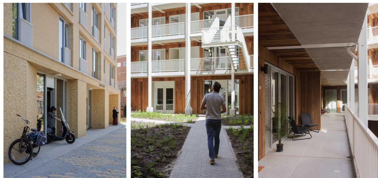
VOORPLEIN - BINNENTUIN - DREMPELZONE

Anders dan het spontane contact, berust gepland contact in het Sumatrahof op organisatie en afstemming: bijeenkomsten, gezamenlijke activiteiten en