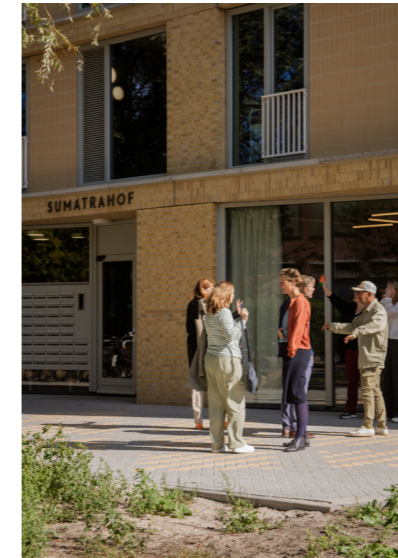
DE GEMEENSCHAPPELIJKE RUIMTE DIRECT NAAST DE ENTREE AAN HET PLEIN