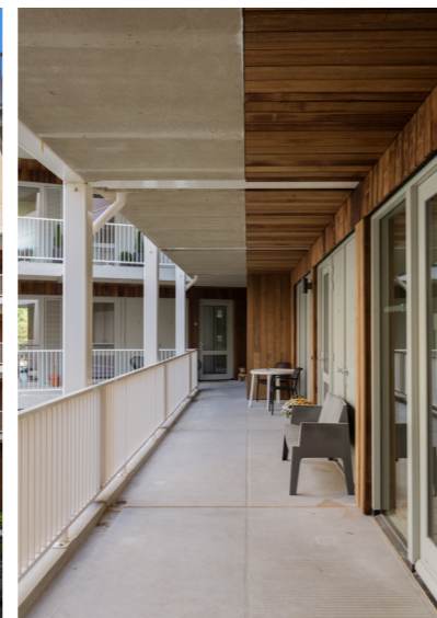
DE BREDE GALERIJ MET EEN STOEP BIJ ELKE VOORDEUR