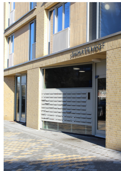
DE RUIPE ENTREEHAL AAN HET OPENBARE VOORPLEIN

Concreet uit dit ontwerp zich in verschillende elementen: het voorplein fungeert als eerste ontmoetingsplek en wordt begrensd door een laag tuinmuurtje dat uitnodigt even te zitten. Op de begane grond zorgen persoonlijke stoepen en eigen trapjes voor een zachte overgang tussen privé en openbaar, waar lichte contacten kunnen ontstaan. Ook de entreehallen zijn ruim en licht, met zicht op de binnentuin en een prominente trap die gebruik stimuleert. Aan de westzijde grenst de hal direct aan de gemeenschappelijke ruimte, met een keuken en toilet; de verdere inrichting bedenken de bewoners gezamenlijk. Het hof vormt een luwe, afgeschermd plekje tussen openbaar en privé, met veel groen. Daarnaast zijn de galerijen extra breed en verdeeld in een loopzone en een private zone, waar bewoners bijvoorbeeld een zitje kunnen plaatsen. Voordeuren zijn verdiept aangebracht en woonkamers grenzen aan de galerij, waardoor deze als verlengstuk van de woning fungeert. Extra buitentrappen - de olifantenpaadjes