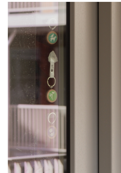
SLEUTELHANGERS WAARMEE BEWONERS HUN INTERESSES KONDEN LATEN ZIEN

Vijftien bewoners reageerden met een duimpje en er wordt besloten om elke eerste donderdagavond van de maand een spelletjesavond te organiseren. Niet lang na dit contact vond de eerste editie plaats in de