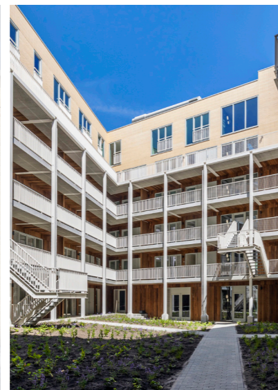
DE LUWE COLLECTIEVE BINNENTUIN MET DE OLIFANTENPAADJES