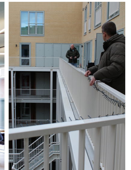
BEWONERS HANGEN KERSTVERSIERING OP IN HET HOF